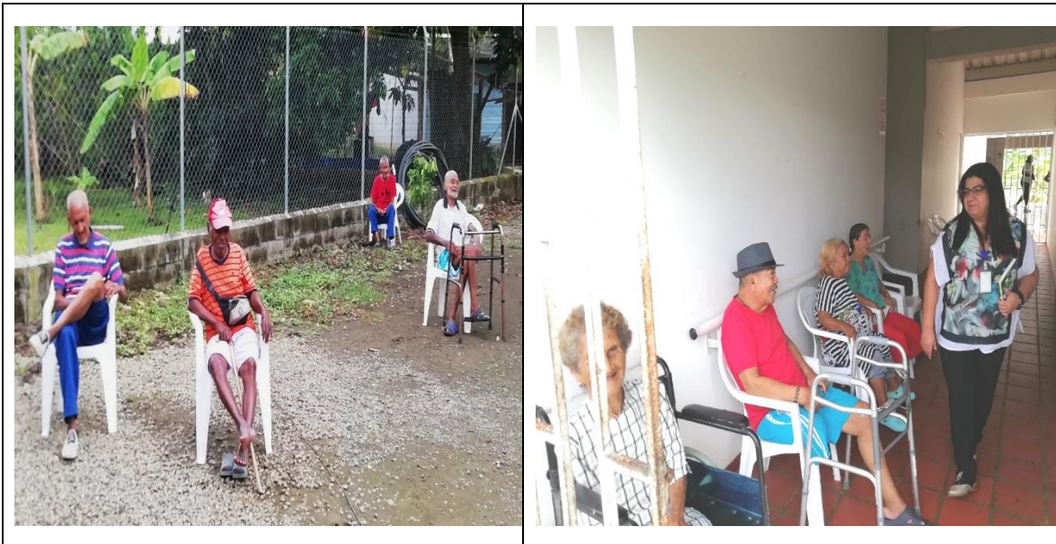
Fuente: Inclusión Social del Municipio de Apartad Elaboró: Beatriz Elena Gómez Sánchez CA Contador

abuelo, además las condiciones ambientales por falta de ventiladores y abundancia de insectos que afectan la SALUD DE LOS ABUELOS.