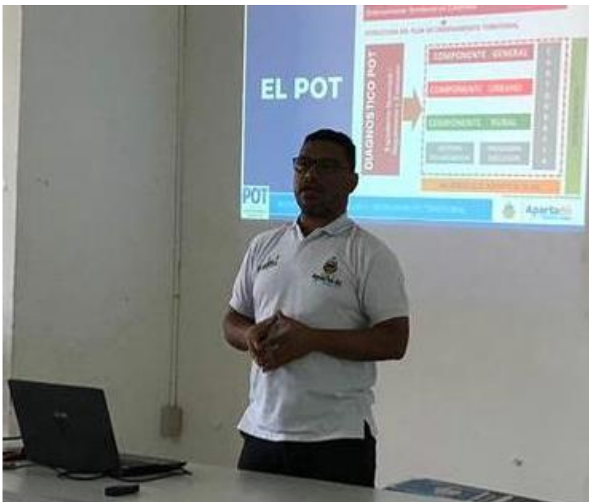
3.1.24. Comité Cívico, Veedurías y líderes del Río