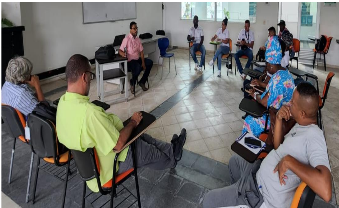
3.1.27. AUGURA / Gremio Industriales / Empresarios