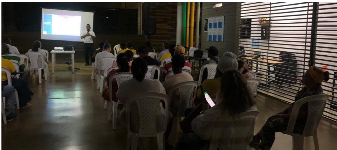
3.1.17. Grupo motor