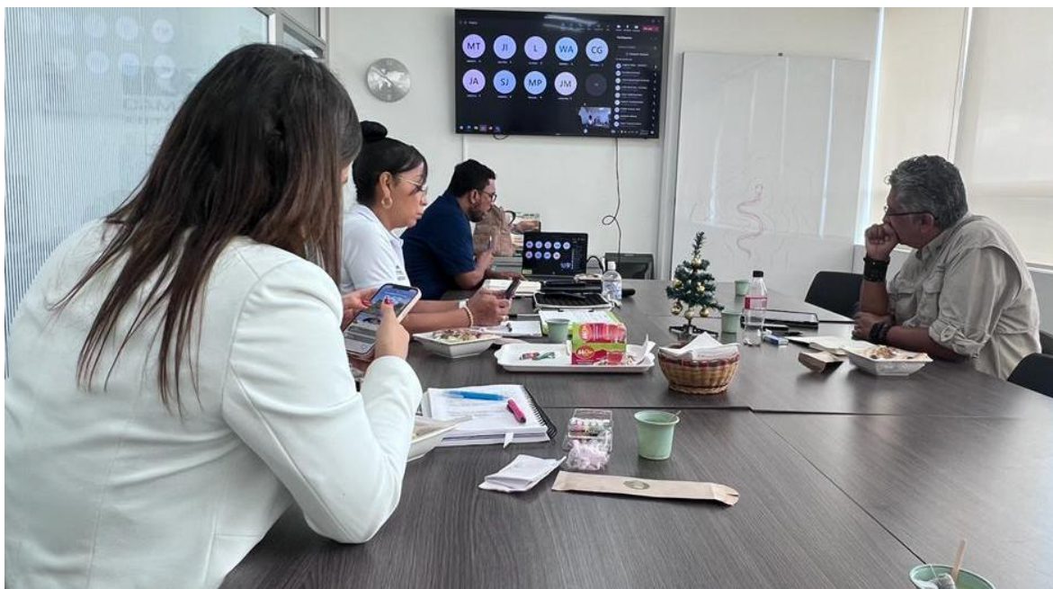
3.1.10. Grupos Poblacionales (Mujeres, jóvenes, Adulto Mayor)