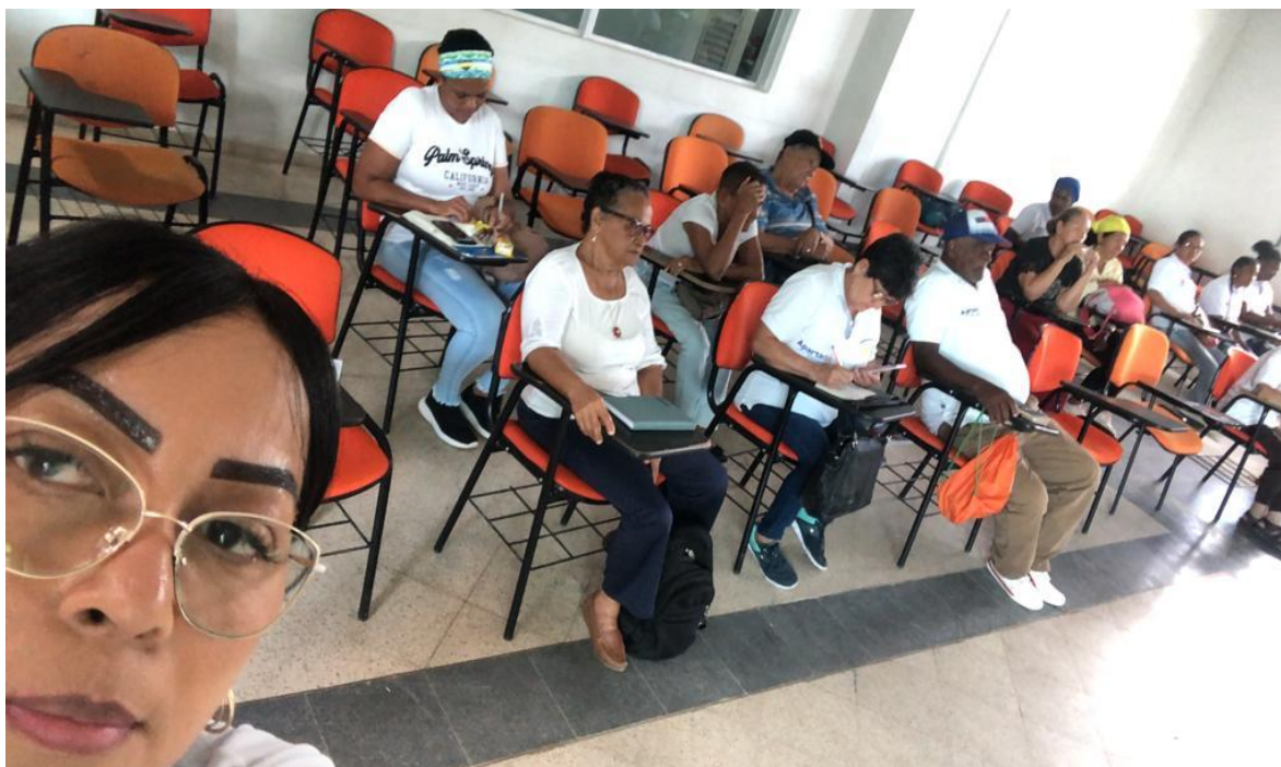
3.1.11. Mesa de víctimas