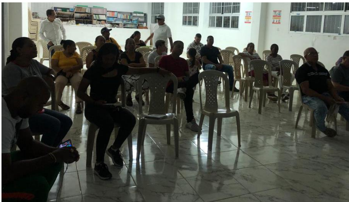
3.1.19. Corregimiento Puerto Girón