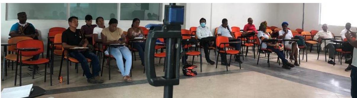
3.1.21. AUGURA / Gremio Industriales / Empresario