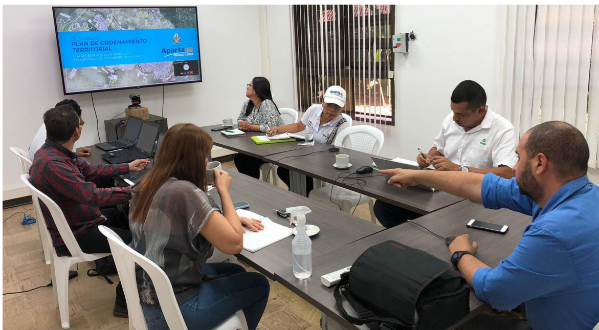
3.1.28. CAMACOL / Líderes de Planes Parciales / Constructores y Gestores de Proyectos Inmobiliarios